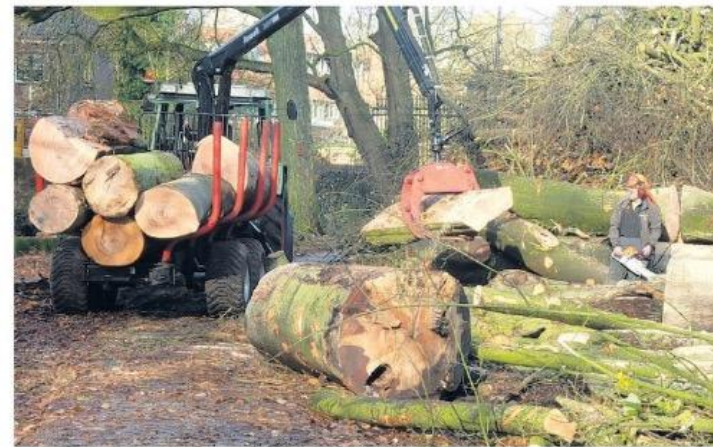
▲ De bomenkap in Park Randenbroek leidde enkele jaren geleden tot grote maatschappelijke commotie. Moeten burgers meer te zeggen krijgen, of beslissen ambtenaren en experts?

Dat wijken zo groen mogelijk moeten zijn, vindt iedereen. Maar moeten particuliere tuinbezitters financieel gestraft worden, bijvoorbeeld door een hogere ozb, als zij hun erf